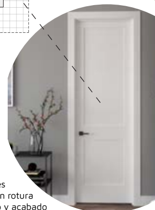
Puertas de paso en color blanco con cuarterones sencillos.