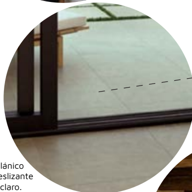
Porcelánico antideslizante color claro.