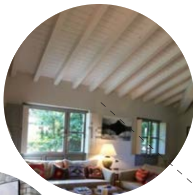
Vigas blancas vistas en salón