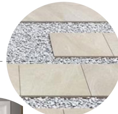
Combinación porcelánico antideslizante color claro y grava.