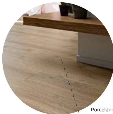
Porcelánico imitación madera.