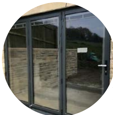
Amplios ventanales con carpintería con rotura de puente térmico y acabado bicolor. Doble acristalamiento con cámara de aire.